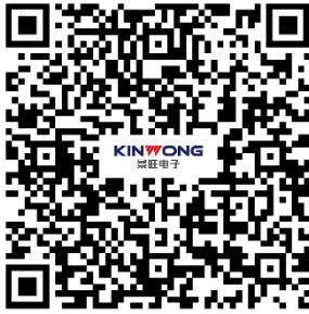
(移动端网申二维码)